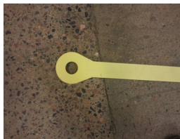
Lyftnyckels ögla 40 mm hål

Fyra st. lyftnycklar används för att lyfta badrummet. En lyftnyckel sätts fast i varje hörn.